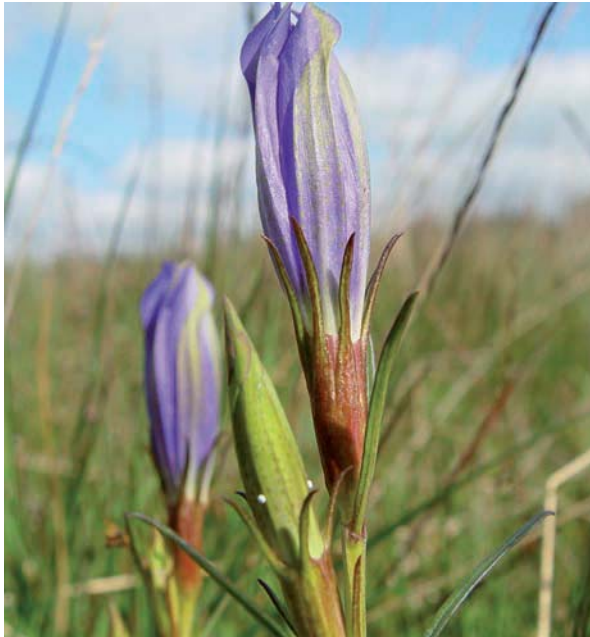
Klokjesgentiaan met eitjes van het gentiaanblauwtje.

de natte heide: hij is een indicator van stikstofarme, vochtige milieus en zijn aanwezigheid is een goede voorspeller voor het voorkomen van andere kenmerkende heidesoorten. De afgelopen decennia zijn juist de kleine, geïsoleerde populaties verdwenen, maar ook in de grotere gebieden zijn de omstandigheden vaak niet optimaal en dat heeft veel te maken met het effect van beheer. De jonge rupsen ontwikkelen zich in de vruchtbeginsels van gentianen, in Nederland de zeldzame klokjesgentiaan, maar na enige weken kruipen ze naar buiten om te worden geadopteerd door passerende knooppieren van het genus Myrmica . Onder de camouflage van geuren en geluiden die de mieren misleiden lukt het hen om hun ontwikkeling tot vlinder