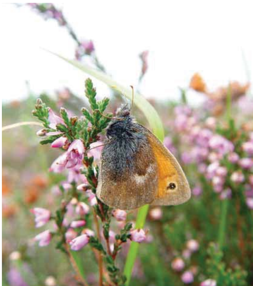
Hooibeestje op de hei.

Tekst: Chris van Swaay De Vlinderstichting Calijn Plate CBS