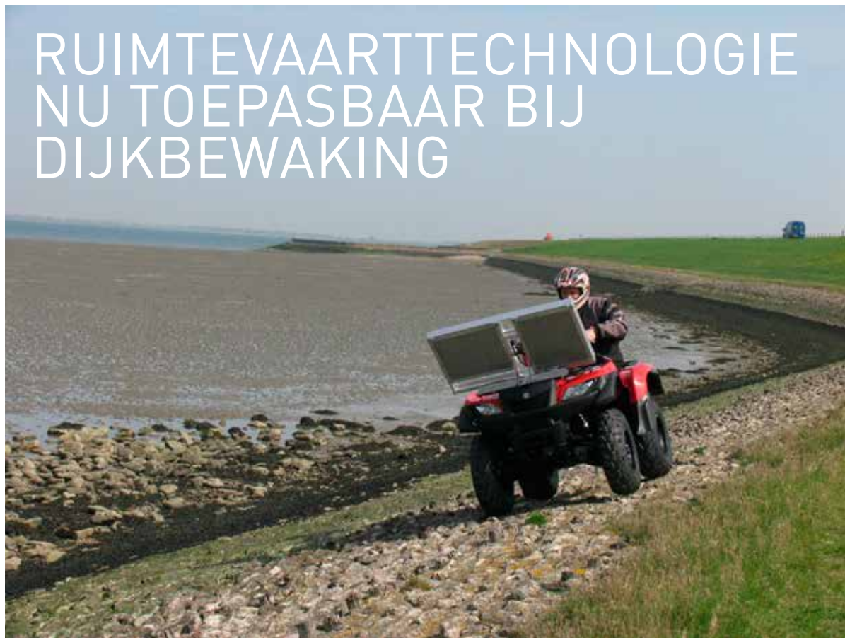
Bij Kattendijke (Zeeland) heeft Rijkswaterstaat de microgolven scanner gemonteerd op een quad

De techniek om met het opvangen van micro-radiogolven bodemvocht te registreren, werd in de jaren zestig al toegepast in de ruimtevaart. Diezelfde techniek kan nu ook op kleine schaal benut worden om de vochthuishouding in een dijklichaam te monitoren.