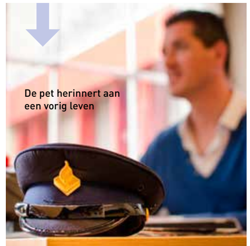
De pet herinnert aan een vorig leven