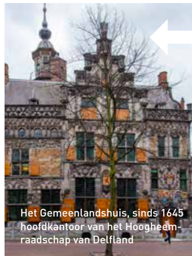
Het Gemeenlandshuis, sinds 1645 hoofdkantoor van het Hoogheemraadschap van Delfland