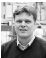
Jan Post Wetsus/AquaBattery