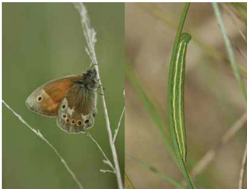
Veenhooibeestje (vlinder en rups).

De mannetjes zijn vaak wat kleiner en donkerder dan de vrouwtjes. De vrouwtjes lijken dus het grootste te zijn en maken een meer oranje indruk. De binnenkant