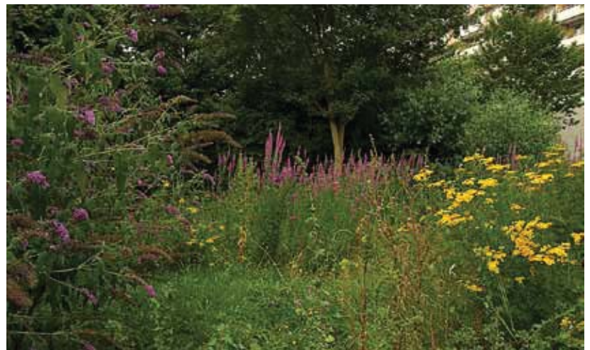
Onze boerenlandvlinders moeten het tegenwoordig hebben van parken en bermen in de stad.

Met steun van de Postcodeloterij gaat De Vlinderstichting de komende drie jaar heel veel bloemrijke gebieden – idylles – aanleggen. Voor mensen om van te genieten en voor vlinders en bijen om beter te kunnen overleven. De graslandvlinders zullen hier zeker baat bij hebben!