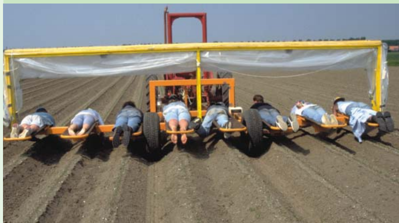
Wie kijkt er naar de biologische bodemkwaliteit?