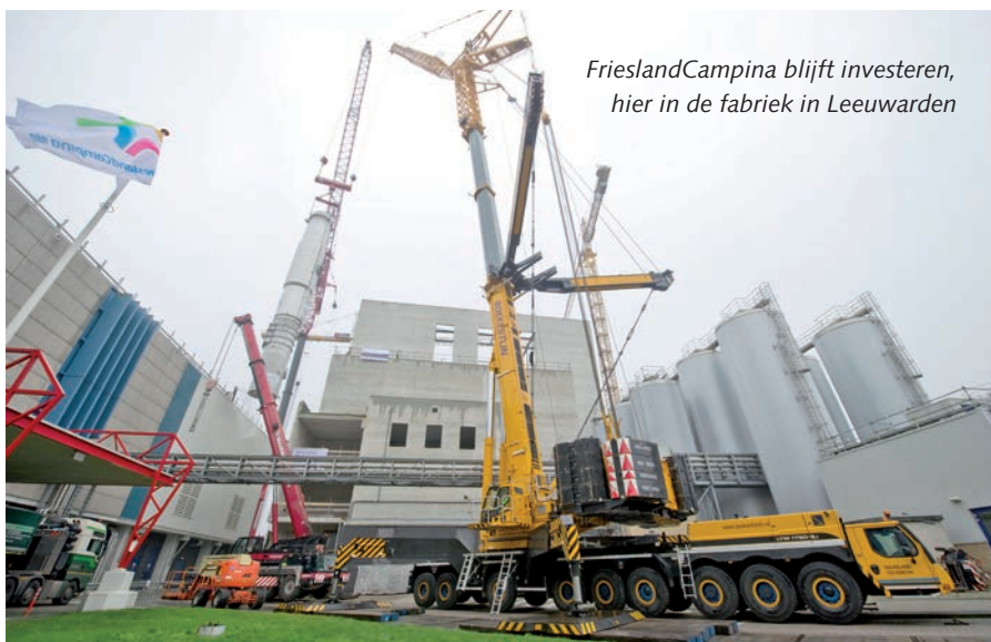
FrieslandCampina blijft investeren, hier in de fabriek in Leeuwarden