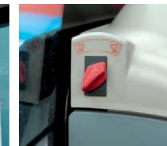
^ Massaslot Op de Landini-trekkers zit tegenwoordig een niet te missen massaslot. Je stapt er tegenaan bij instappen.