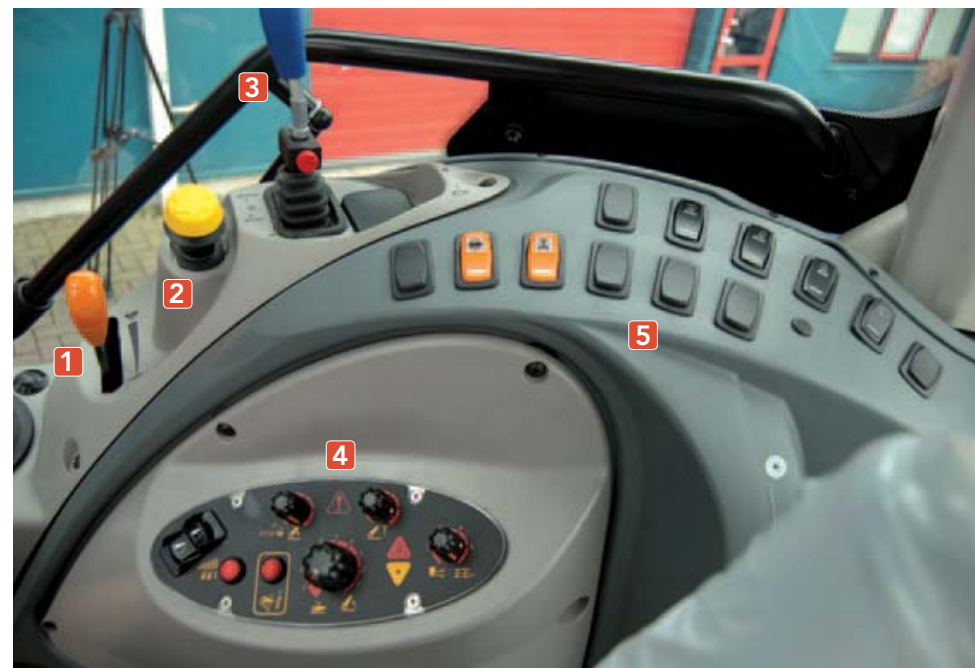
^ Zijconsole Veel uitleg behoeft de rechterconsole niet. De oranje hendel [1] is voor het handgas, de gele [2] om de aftakas in te schakelen en de blauwe [3] voor het derde hydrauliekventiel. Op het zwarte paneeltje [4] vind je alles wat nodig is om de hef in te stellen en te regelen. Zaken als hefhoogtebegrenzing kun je ook instellen op het dashboard. Voor de overige functies (differentieelsloten en werkerlichting) zijn er tuimelschakelaars [5].