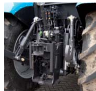
^ Achterbrug Veel innovatie zit er niet op de 6-175L. Ook aan hef, hydrauliek en trekhaken is weinig toe te lichten. Vijf ventielen is een optie.