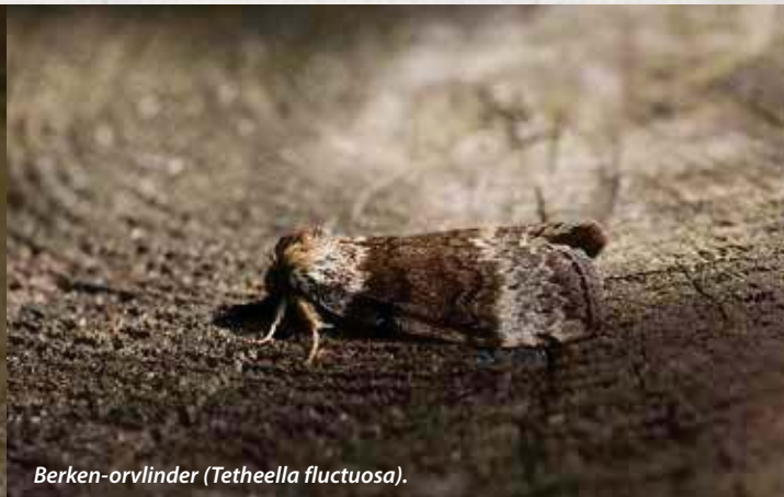
Berken-orvlinder ( Tetheella fluctuosa ).