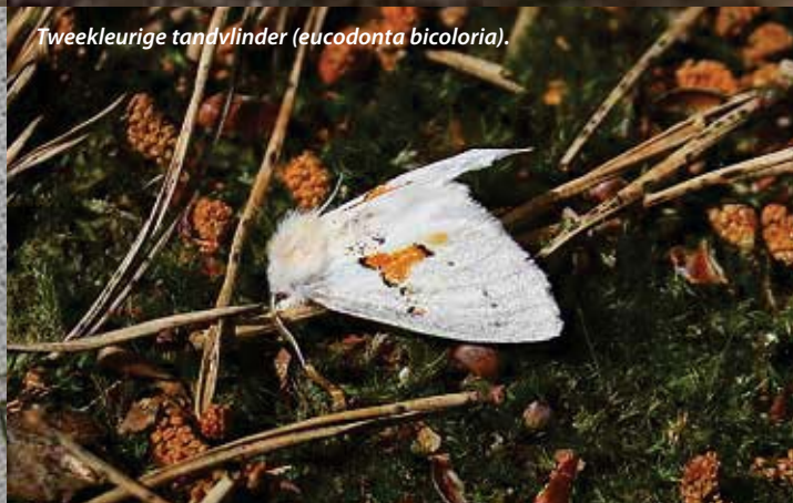
Tweekleurige tandvlinder ( Eucodonta bicoloria ).

Er werden maar liefst 406 soorten genoteerd tijdens de 42 nachten op de 39 locaties.