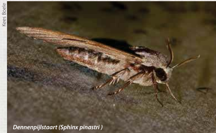
Denneppijlstaart ( Sphinx pinastri )