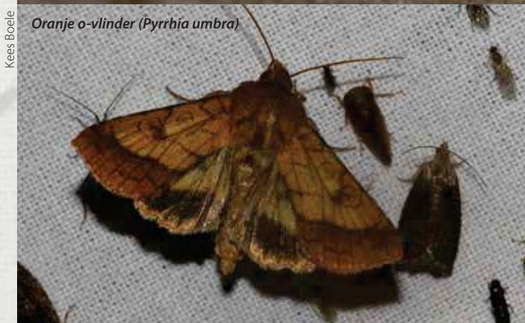
Oranje o-vlinder ( Pyrrhia umbra )