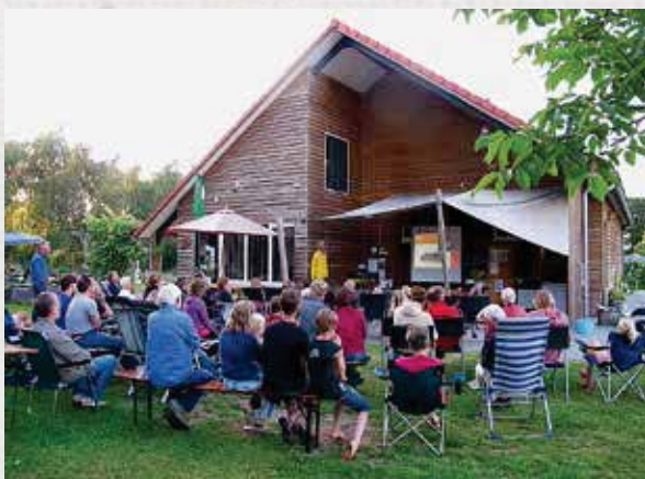
Lezing voorafgaand aan het nachtvlinders.

en-zoutvlinder ( Biston betularia ) / blauwooggrasmot ( Agriphila straminella , beide 25). Iedereen vraagt altijd naar de meest bijzondere vlinder. Was dat nu de tweestreepgrasuil ( Mythimna turca ) die als zuidelijke soort voor het eerst de Overijsselse Reest bereikte op Landgoed Vilsteren? Of was het de tweekleurige tandvlinder ( Leucodonta bicoloria ) op dezelfde plek? De witvlekbosrankspanner ( Melanthia procellata ) in Vaals? De brummelspanner ( Mesoleuca albicillata ) in Buurse? Of toch die drie paddenstoeluiltjes ( Parascotia fuliginaria ) in Boyl, Sellingen en Nederhemert-Zuid? De complete soortenlijst van alle 39 locaties is te groot voor dit artikel. U kunt hem vinden rechts op de startpagina van www.nachtvlindersnacht.nl .