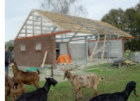
De dieren krijgen een nieuwe stal in Holten.