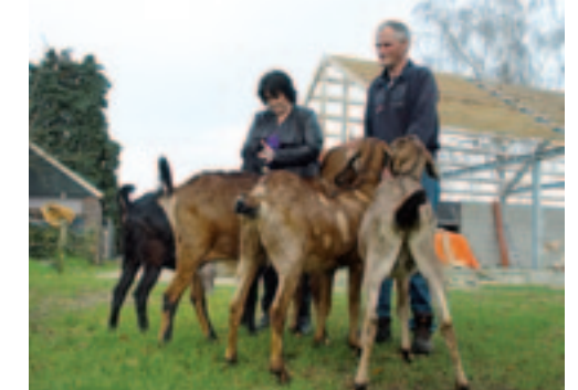
Wie geeft wie nou aandacht?