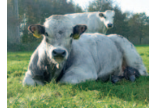
De beestenboel bestaat niet alleen uit geiten, er lopen ook Piemontese koeien.