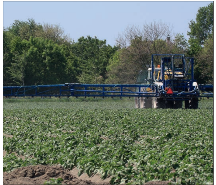
Onderzoekers ontdekten dat bij loofbesmetting van 100 procent schoon uitgangsmateriaal bacteriën zich vermenigvuldigen en verplaatsen vanuit blad via stengel naar de ondergrondse delen.