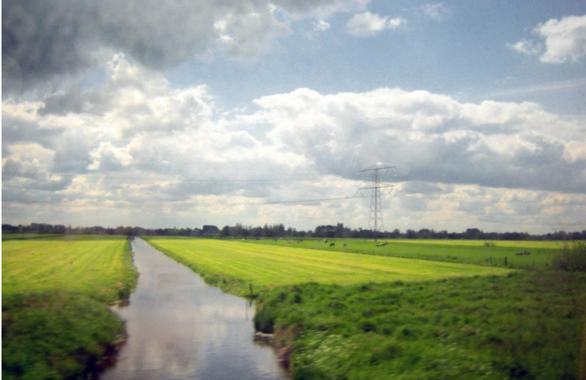
Afbeelding 1 Het uitgestrekte landschap van het Groene Hart moet behouden blijven met behulp van spoorlijnpanorama's