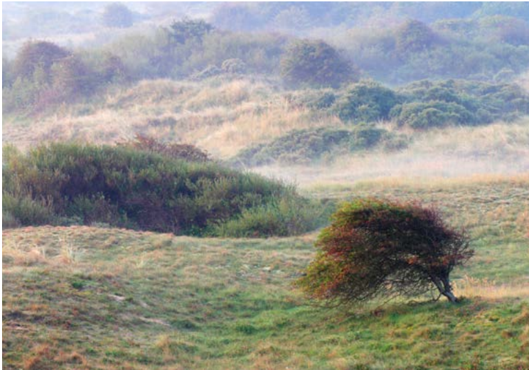
VERGRASSING EN OPSLAG VAN STRUWELN IN DUINGEBIED

Vroeger deed ontginning van 'woeste gronden' de tapuit de das om. Nu lijdt de soort onder stikstofdepositie, verstarring van de duinen en afname van het konijn