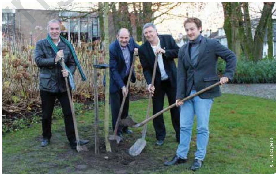
▲ Vertegenwoordigers van het Verbond van Boomtelers, Entente Florale, VVOG en Stad Eeklo plantten de eerste herdenkingsboom in de reeks van 40

Dankzij de medewerking van het Verbond van Boomtelers (AVBS) zullen in de loop van volgend jaar nog 39