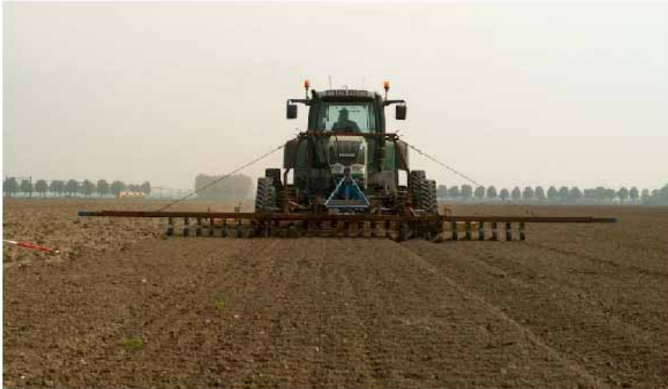
Figuur 1 Rijpadentrekker met rubber rupsbanden en RTK-DGPS besturing

blijven volgen (gevaar van afglijden). Omdat voor de oogstwerkzaamheden vanaf de rijpaden er grote aanpassingen aan oogstmachines en oogstmethoden nodig zijn, zijn deze nog niet aanwezig, maar worden wel verder ontwikkeld.