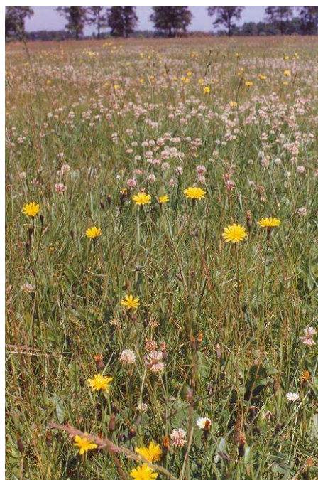
Herfstleuwetand en Witte Klaver