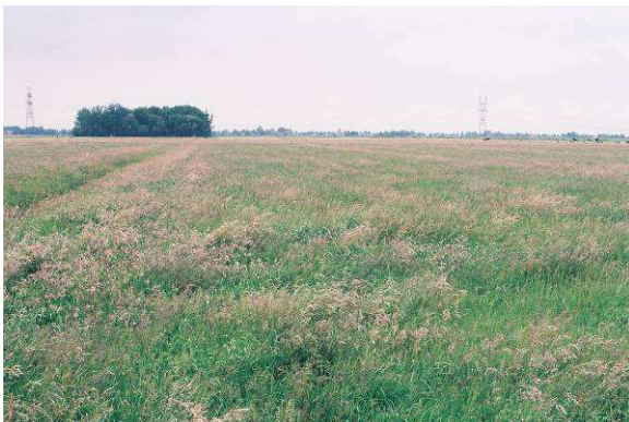
Beheersland voor ruwvoerwinning dat wordt overheerst door Gestreepte witbol, Ruwbeemdgras en Engels raai gras