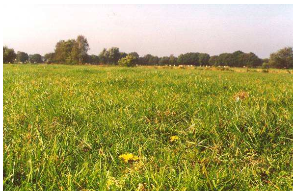
Zode met 'fijne' structuur van goede grassen en een beperkt aandeel kruiden

Is er op het onderzochte grasland sprake van biodiversiteit die uw bedrijfsvoering ondersteunt? Bij de beoordeling wordt rekening gehouden met een verschil tussen hoogproductieve percelen en percelen die vooral dienen voor ruwvoerwinning. Biodiverse hoogproductieve percelen hebben een fijne menging van enkele grassoorten waaronder een groot aandeel 'goede grassen' (engels raaigras, beemdgrassen, timoteegras, beemdlangbloem) met hier en daar een kruidachtige. Gebruik van klaver is een pré.