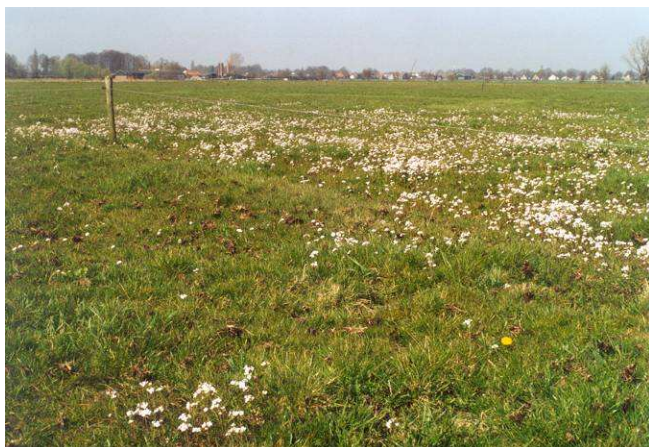
Pinksterbloem achter aan de kavel

Op percelen voor ruwvoer komen meer soorten voor. Het regelmatig voorkomen van plantensoorten van de vragen 6 t.m. 10 duidt op problemen. Op minder productieve percelen mag zeker wel een bijmenging zijn van niet-problematische soorten, bijvoorbeeld: pinksterbloem, madeliefje, veldzuring, herfstleuwetand en biggekruid. Om naast de positieve effecten van biodiversiteit, ook te kunnen profiteren van subsidie voor (agrarisch of particulier) natuurbeheer is deze bijmenging noodzakelijk voor het bereiken van 15 inheemse soorten per 25 m 2 .