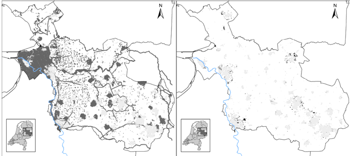
FIGUUR 2 DE WATERBEHEER GERELATEERDE BELEIDSARIANT VOOR DE PROVINCIE OVERIJSEL MET LINKS (IN ZWART) DE RESTRICTIES WAAR NIEUWE BEBOUWING WORDT ONTMOEDIGD EN RECHTS DE VEGELIJKING MET DE TRENDVARIANT; ZWART IS ALLEEN BEBOUWD IN DE BELEIDSARIANT, DONKER GRIJS ALLEEN IN DE TRENDVARIANT (KOOMEN ET AL., 2008).

ruimtelijk beleid. Hierbij is in detail gekeken naar bijvoorbeeld de openheid van het landschap en de potentiële economische schade en slachtofferaantallen ten gevolge van overstromingen. De toepassing van de Ruimtescanner heeft daarmee een belangrijke bijdrage geleverd aan het planMER op de omgevingsvisie (Koomen et al., 2011; Province of Overijssel, 2009).