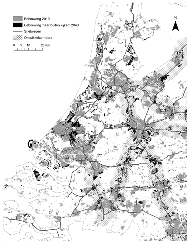
FIGUUR 3. VERBEELDING NIEUWE VERSTEDELIJKING IN HET 'NAAR BUITEN KIJKEN' CONCEPT .

De kaarten die het snelwegcorridor concept verbeeldden, vielen bij VROM het meest in de smaak. Deze beelden lieten sterk geconcentreerde verstedelijking zien binnen snelwegcorridors rond de Randstad. De aannames achter dit 'naar buiten kijken' concept zijn in de verbeelding benadrukt (zie de 'ontwikkelcorridors' in Figuur 3). Deze kaart, waarin het achterliggende planconcept wordt verbonden met de verbeelde concepten, bleek veelzeggender dan gebruikelijke ruimtegebruikskaarten. Sterker nog, de gedetailleerde weergave van verstedelijking in deze kaarten riep meer vragen op (waarom hier? houd je wel rekening met zus? kan het niet zo?) dan zij beantwoordde. Met name in strategische planvormingsprocessen is het kiezen van een visualisatievorm die recht doet aan de aannames en onzekerheden die achter de kaartbeelden liggen een grote uitdaging.