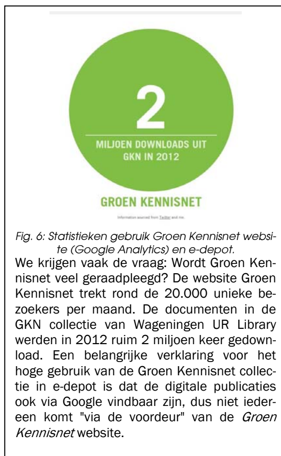
Fig. 6: Statistieken gebruik Groen Kennisnet website (Google Analytics) en e-depot.

geningen voor een introductie over het zoeken in Groen Kennisnet en maken dan meteen gebruik van de uitgebreide collectie die Wageningen UR