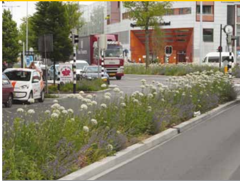
Balijelaan, nieuwe situatie.

‘Alleen soorten die hoger worden dan 40 cm, goed uitstoelen, dichte zoden vormen en toekomst met één jaarlijkse maaibeurt zijn bruikbaar.’ Reden: het gros van de onkruidgroei verliest het al snel van deze stevige vaste planten.