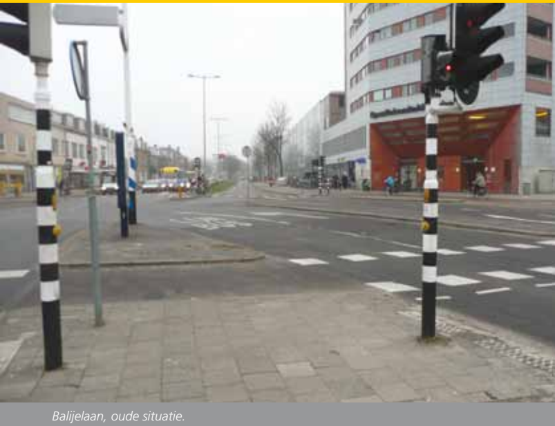
Balijelaan, oude situatie.