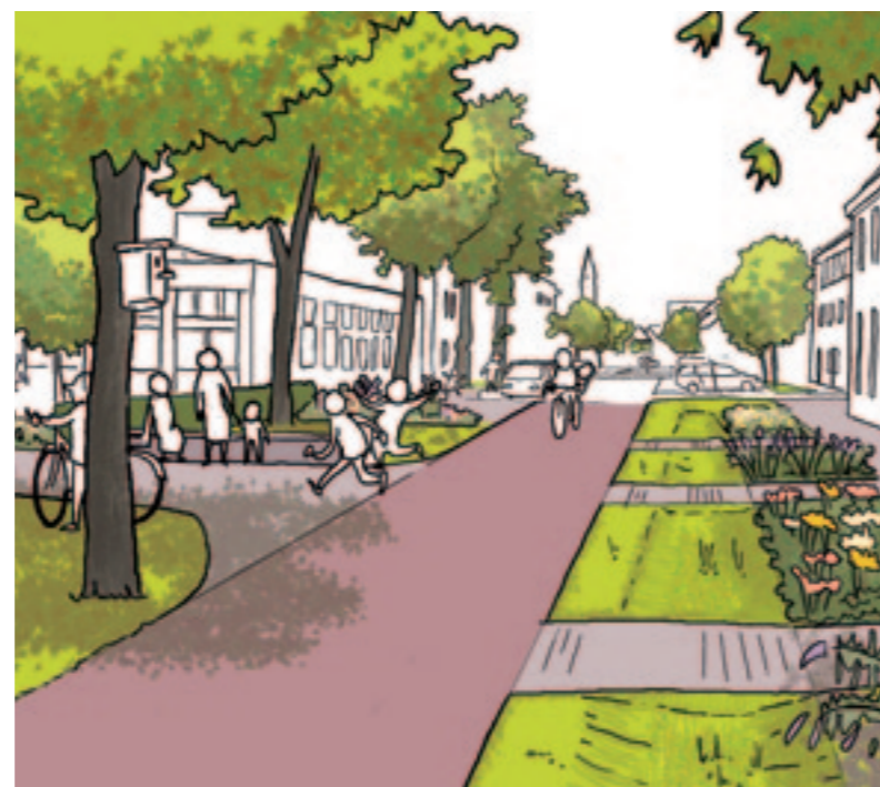
Situatie Maasstraat voor en na ‘groene ingreep’. Illustratie: Ronald van der Heide.