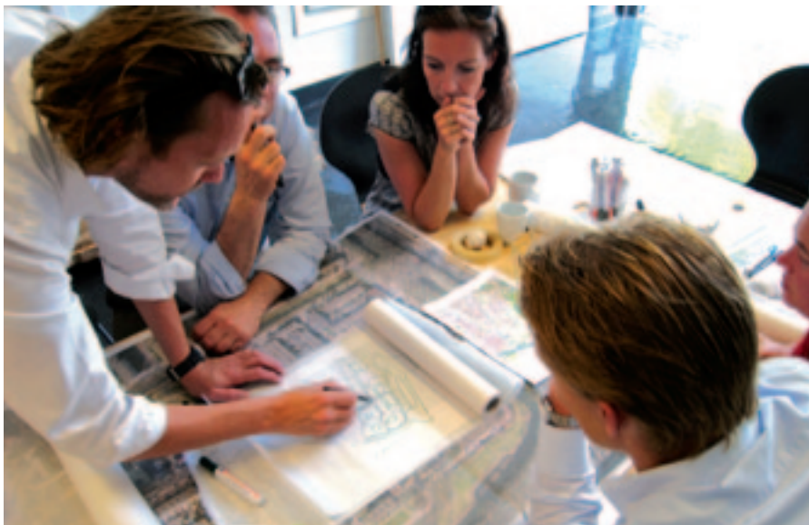
In werkateliers werden voorstellen bedacht voor drie deelgebieden in Utrecht.