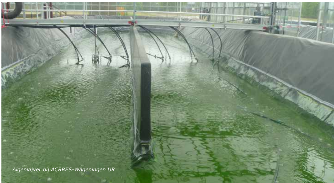
Algenvijver bij ACRRES-Wageningen UR

Vetzuursamenstelling van lipiden van verschillende algen (mg g -1 drooggewicht), (Becker, 2013)