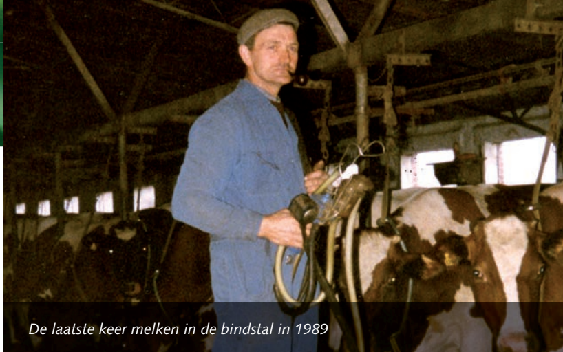
De laatste keer melken in de bindstal in 1989