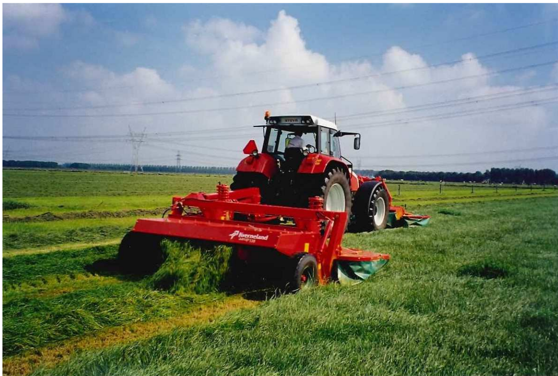
Foto. Maaien en kneuzen

Een ander bijkomend voordeel van het zo snel mogelijk schudden, liefst als combi maaien/kneuzen in 1 werkgang, is dat bij goed drogend weer 1 keer extra schudden kan vervallen. Ook kan na maaien met kneusinstallatie de eerste keer sneller worden gereden bij het schudden, omdat het gewas al verspreid op het veld ligt. De gecombineerde werking van maaien/kneuzen leidt volgens onderzoek niet tot extra veldverliezen of brokkelverliezen. Ook wordt het product niet extra verontreinigd met grond. Wel vraagt een gecombineerde maaier/kneuzer meer trekkervermogen. Dit is bij een werkbreedte van 1,65 meter al 9-15 kW extra. Ook is een gecombineerde maaier/kneuzer bij aanschaf duurder dan alleen een maaier. Het gebruik van maaier/kneuzer combinaties is om deze redenen daarom waarschijnlijk niet gebruikelijk bij het maaien van wegbermen en natuurterreinen.