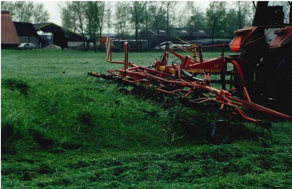
Foto. Gras schudden

worden. In combinatie met een laag toerental van de aftakas wordt daardoor voorkomen dat het gras in de sloot of greppel of op de afrastering terecht komt. Voor bermen en kaden zijn de bredere types niet geschikt.