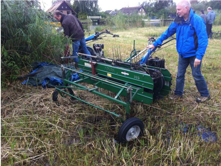
Foto. Hark in de Weerribben.