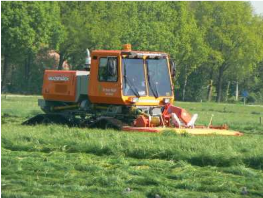
Foto. Rupsmaaier van de Beijer Bladel

Alle cirkelmaaiers kunnen worden uitgerust met een kneusinrichting. Deze inrichting kneust/beschadigt de celwanden/waslaag, waardoor het droogproces versneld wordt. Ook komt het zwad beter verspreid op het land (groter droogoppervlak). Een maaier met kneusinrichting vraagt meer trekkracht en dus meer brandstof per gemaaide eenheid.