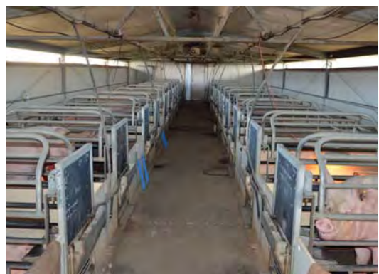
De zeugen zijn een kruising tussen het Landras en het Yorkshire varken.