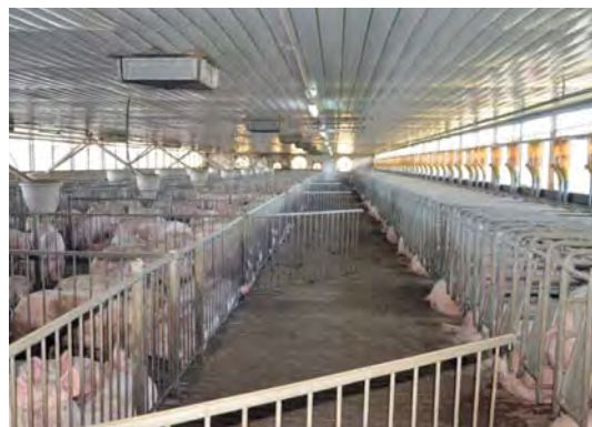
Verdonschot heeft zijn bedrijf uitgebreid naar 220 zeugen en 1.500 vleesvarkens.