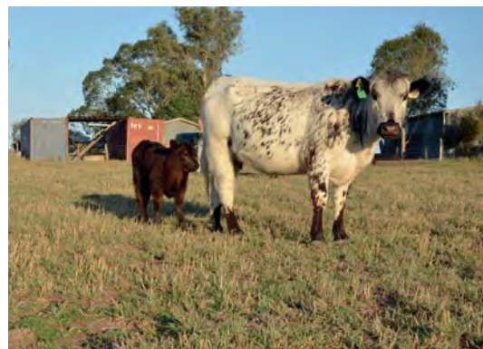
De Nederlander is een pionier in Australië met het Canadese rundveeras Speklepark.