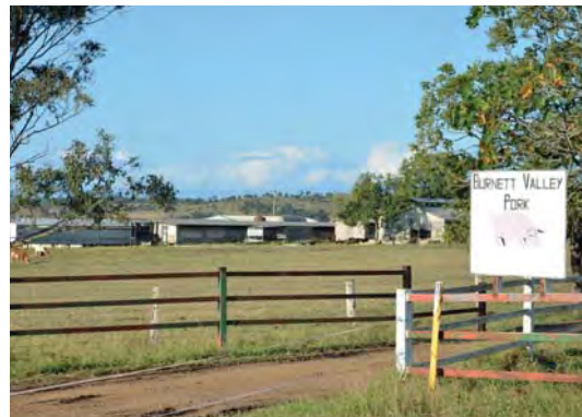
Burnett Valley Pork ligt bij het dorpje Monto in de noordoostelijke staat Queensland.