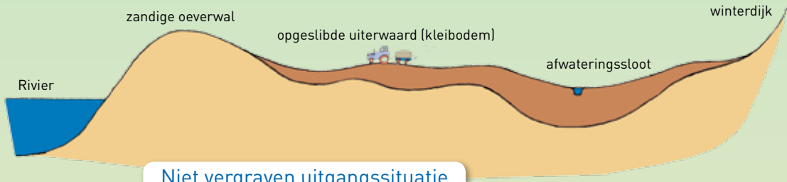
Niet vergraven uitgangssituatie