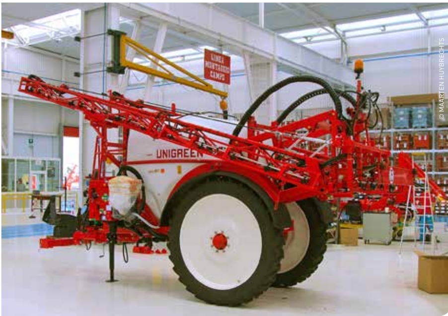
Unigreen bouwt reeds al vele jaren gedragen spuitmachines. De klemtoon verschuift naar getrokken en zelfrijdende spuitmachines.

De invoer van dit merk gebeurt door Maschio Benelux in Paal-Beringen, waar ook de vestiging is van Agropak. ■