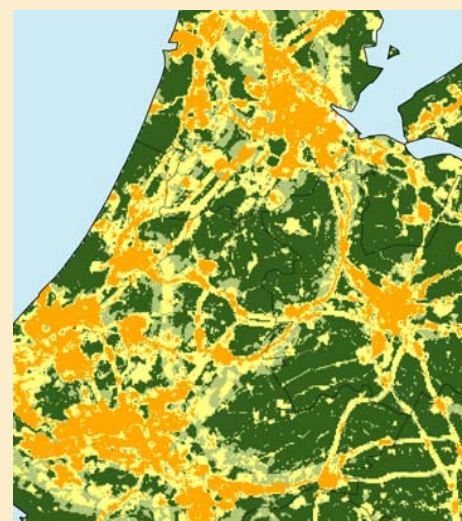
Visuele verstoring door verstedelijking, 2004

De WOT Natuur & Milieu heeft de verstedelijking van de Groene Ruimte in kaart gebracht door niet alleen het fysieke ruimtebeslag te