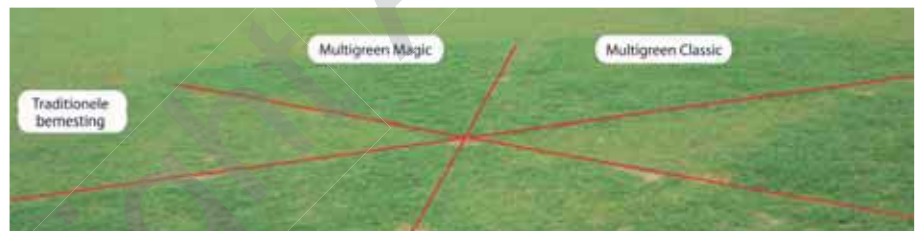
Proefveld sport 31 maart 2012

meststoffen geeft een donkergroene kleur en een dichte grasmat met weinig kans voor straatgras en onkruid. Zowel MultiVerdo (fijn korrelig snelwerkend kaliumnitraat voor golf) als Multigreen Classic en Multigreen Magic (voor sport en golf) leveren uitstekende resultaten.