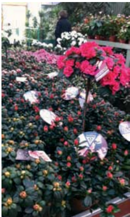
▲ 33% had een uitstekend aanbod qua kleur, vormen en aantal.

lijkt dat er azalea's in zeer verschillende bloeistadia terug te vinden waren, in veel gevallen ook in heel erg groen stadium.