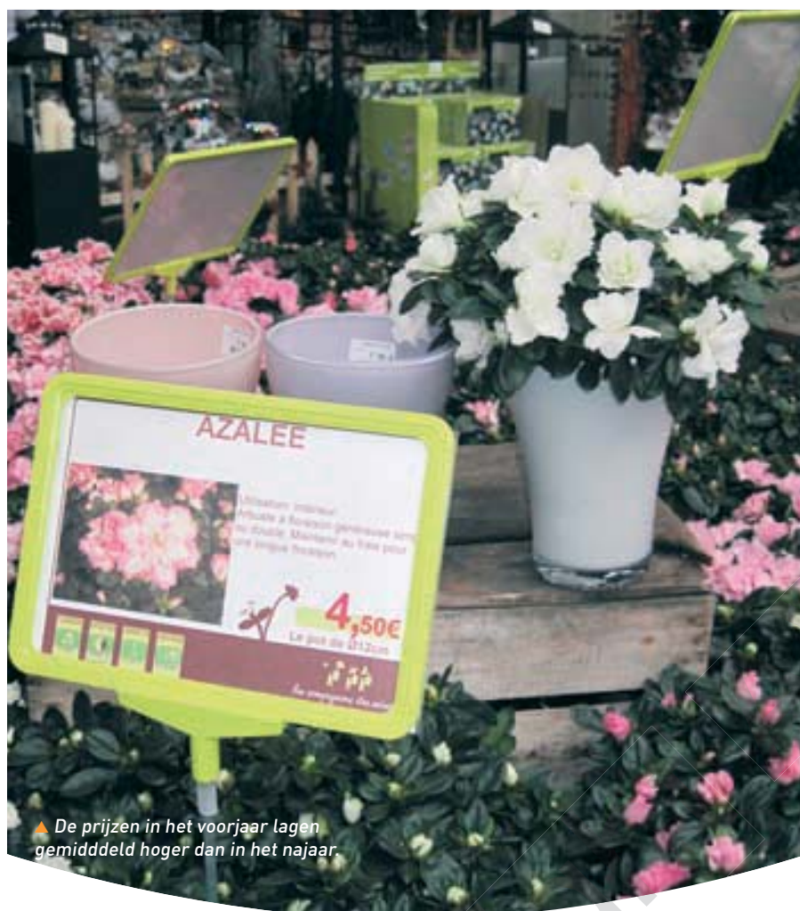
▲ De prijzen in het voorjaar lagen gemiddeld hoger dan in het najaar.