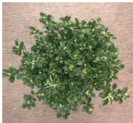
▲ Resultaat van een uitbloeioproef: van het tuincentrum naar de huiskamer.

In opvolging van de enquête werden de quoteringen aan de betrokken tuincentra overgemaakt waarin ook duidelijk werd gewezen op de punten waar het betrokken tuincentrum goed en minder goed op scoorde. Het verslag van deze azalea-enquête zal ook gepubliceerd worden in het ledeninfoblad van de Belgische Tuincentra Vereniging. ■