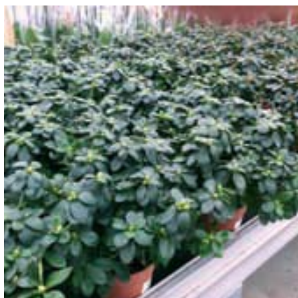
▲ In veel gevallen werden ook erg groene azalea's aangeboden.

“Tuincentra hebben doorgaans een goed tot uitstekend aanbod aan azalea's”