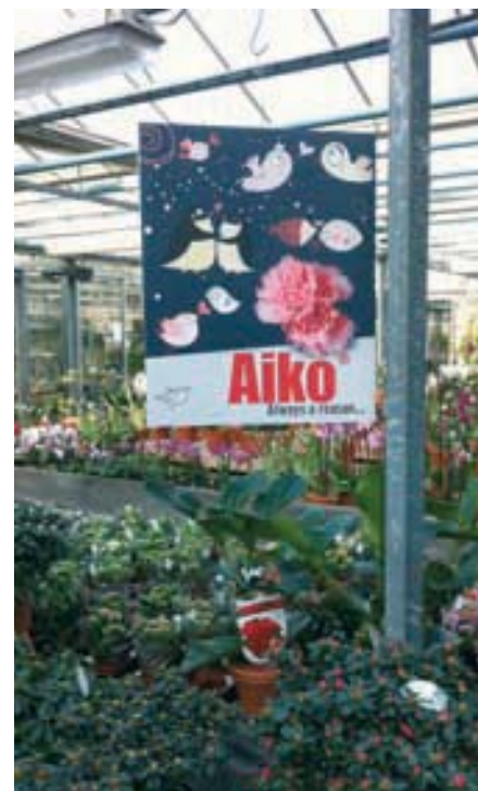
▲ Qua presentatie waren er goede voorbeelden maar slechts 20% van de bezochte tuincentra presenteerde de azalea's uitstekend.

De vochttoestand van de azalea's was algemeen heel goed. Slechts in 15% van de gevallen stonden de planten te nat of te droog. Het is niet verwonder-