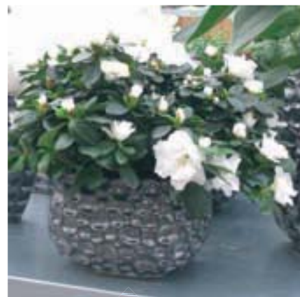
▲ Slechts in 30% van de tuincentra wordt de azalea anders gepresenteerd.