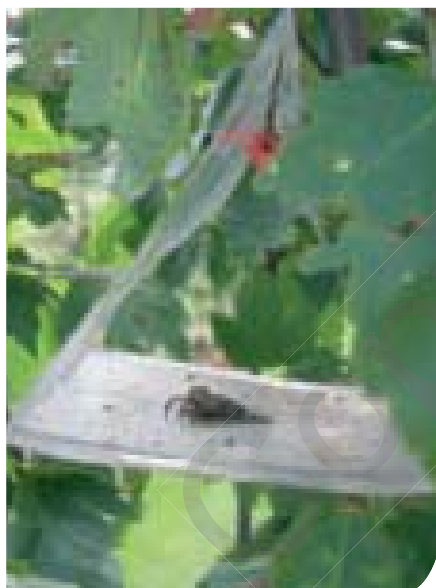
▲ Lymantria dispar of de plakker in een deltaval.