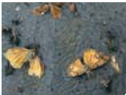
▲ De witvlakvlinder of Orgyia antiqua is gemakkelijk te herkennen aan de witte stippen bovenaan de vleugels.

Om de instap op deze techniek voor u zo gemakkelijk mogelijk te maken, bieden wij vanaf 2012 de feromonen en de nodige vallen te koop aan op het PCS en krijgt u de nodige informatie rond deze techniek. U kan feromonen en vallen bestellen via het bestelformulier dat terug te vinden is op onze website ( www.pcsierteelt.be – Waarschuwingen). De eerste 15 waarnemers die zich aanmelden als medewerker aan het waarschuwingssysteem krijgen voor 5 parasieten (in samenspraak met PCS) gratis vallen en feromonen van het PCS ter detectie van deze parasieten op hun bedrijf. Wij bezorgen de deelnemers bij de levering van de vallen een handleiding om de bestelde vallen en feromonen te monteren. Informatie over het gebruik en de praktische toepassing voor de