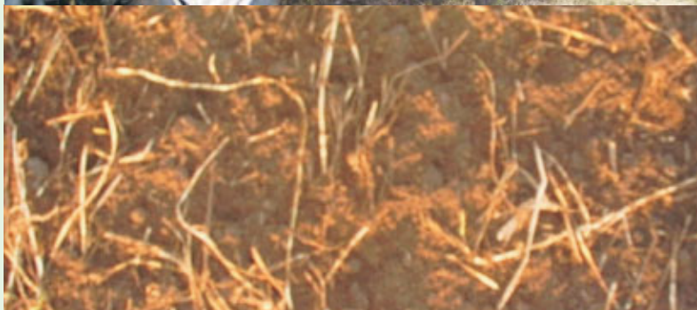
'Kvik up' en resultaat op wortel-onkruid na inzet in stoppel.