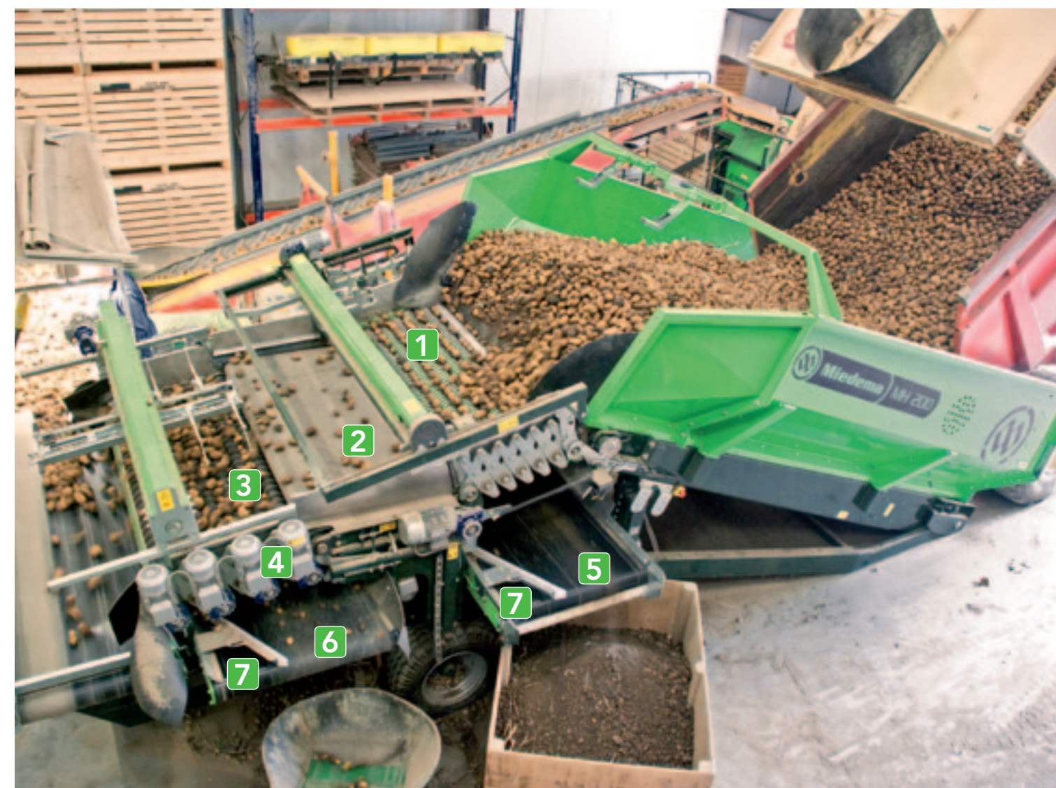
^ Miedema MH200 in detail Vanuit de bunker komen de aardappelen terecht op de spiraalrollen [1]. De spiraalrollen worden door twee motoren en kettingen aangedreven. Dan volgt een tussenband [2] die de aardappelen op de voorsorteerder [3] lost. De rollen van de voorsorteerder hebben voor de aandrijving elk een eigen motor [4]. De afvoerbanden voor grond [5] en de ondermaat [6] zijn bijna een meter breed. Met strijkers [7] kun je de afvoer smaller maken.

De voorsteerder heeft zeven harde kunststof rollen met kunststof schrapers die afzonderlijk worden aangedreven. De sorteermaat verstel je met twee elektrische cilinders. Je kunt de verstelling aflezen, maar heel duidelijk is dat allemaal niet. Voor de zekerheid geldt hier dus: