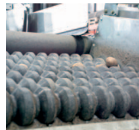
^ Voorsorteerder De harde kunststof rollen van de voorsorteerder worden afzonderlijk aangedreven. Met twee elektrische cilinders stel je de maat in.