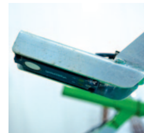
^ Sensoren Boven de bunker hangen twee sensoren die de belastingtoestand van de bunker in de gaten houden.