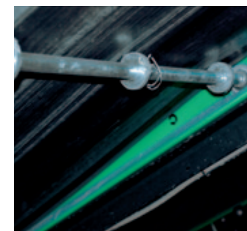
^ Matbegeleiding De afvoerbanden voor grond en de ondermaat worden aan de onderzijde ondersteund door assen met drie steunwielletjes.