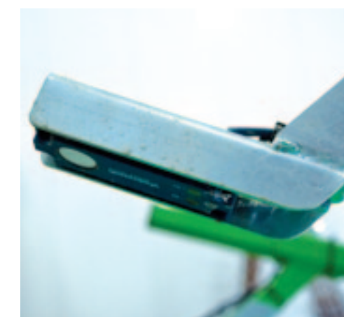
^ Sensoren Boven de bunker hangen twee sensoren die de belastingtoestand van de bunker in de gaten houden.