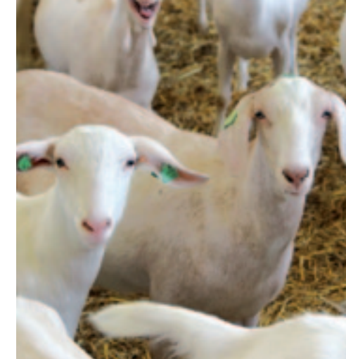
Nubische invloeden zijn in de stal duidelijk te zien.