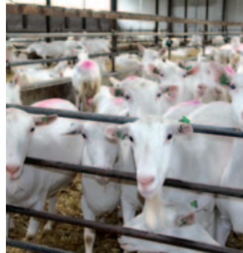
Schape zijn rustig en geiten zijn slopers. Dat is een groot verschil, vindt Reinders.