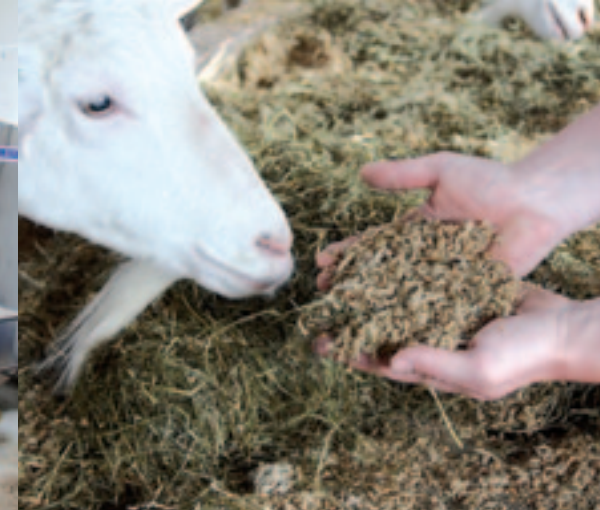
Met bijproducten de kosten zo laag mogelijk houden is voor Reinders een hobby.