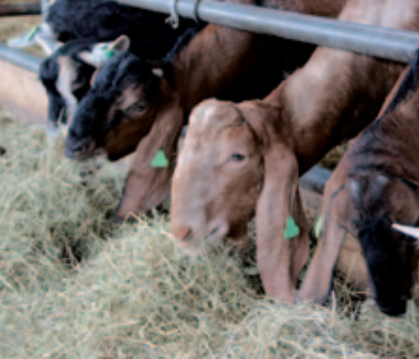
Als experiment heeft Reinders drie Nubische bokken bij de 200 stuks jongvee lopen.