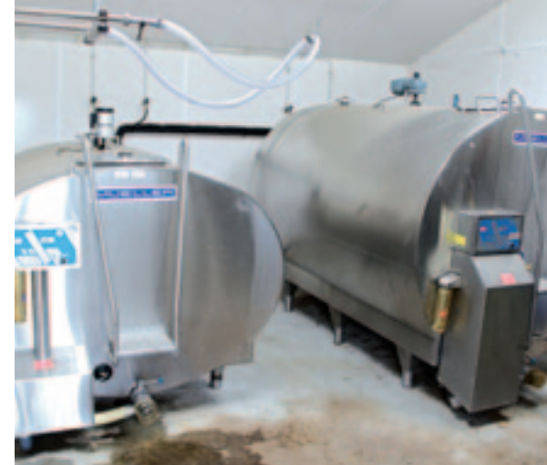
De voormalige melktank voor de schape wordt nu ook gebruikt voor geitenmelk.