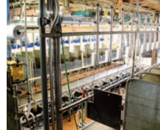
Enkel tepelvoeringen en pulsatieslagen zijn aangepast voor de overstap naar geiten.