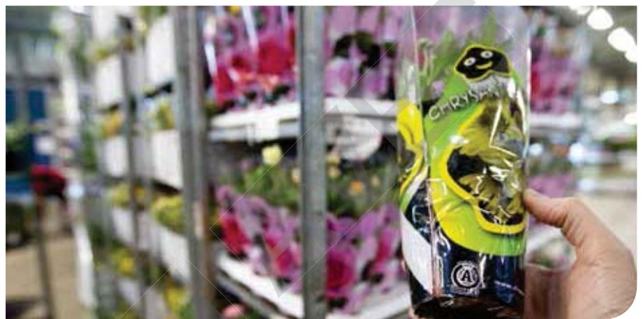
▲ MPS-A moet aan de vraag van de toekomst voldoen. Daarom zet MPS sinds vorig jaar zwaarder in op controles via monstername.

MPS-ECAS verleent en verlengt op basis van inspecties het MPS-ABC