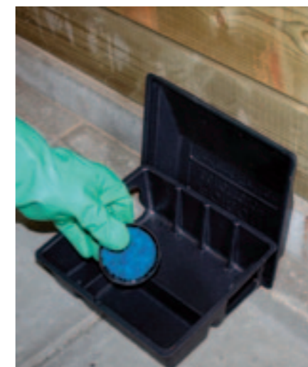
Een lokaasunit voor binnen (l.) en knaagschade aan bedrading (r.).

Uitwerpselen van de ratten in de stal zijn het overtuigende bewijs dat de dieren ter plaatse zijn. De uitwerpselen van de zwarte rat zijn spits en dunner dan die van de bruine rat. Van Veldhuijzen: "Ze zijn een beetje banaanvormig. Als alle uitwerpselen van dezelfde grootte zijn, heb je te maken met een beginnend probleem. Liggen er ook kleinere uitwerpselen, dan zijn er jongen en heb je een hele populatie in de stal." Als een veehouder van de ratten af wil, zullen ze moeten worden gevangen. Daarvoor kan in de stal, zo dicht mogelijk bij het leefgebied van de ratten, een speciale kist met lokaas worden geplaatst. "Probeer ze dan eerst maar eens aan het eten te krijgen", zegt Van Veldhuijzen. "Dat alleen al is niet makkelijk, want zwarte ratten zijn extreem neofobisch. Dat betekent dat ze zeer argwanend zijn als het gaat om nieuwe dingen in