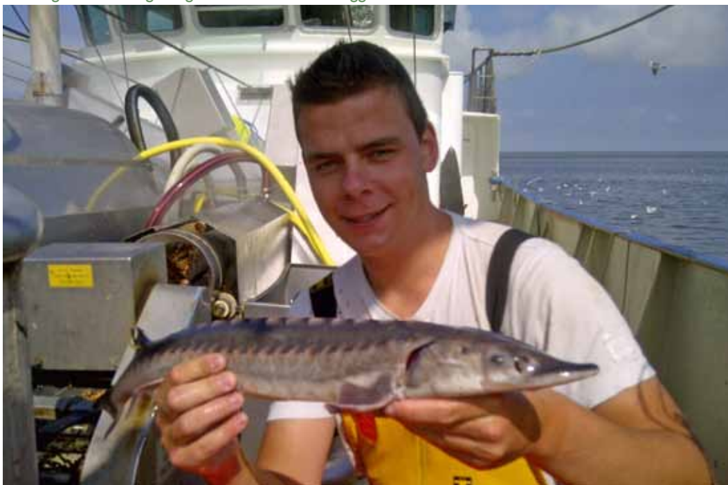
Een uitgezette steur gevangen en weer levend teruggezet.

Helaas blijkt dat ondanks vele inspanningen nog steeds Atlantische steuren gevangen worden en