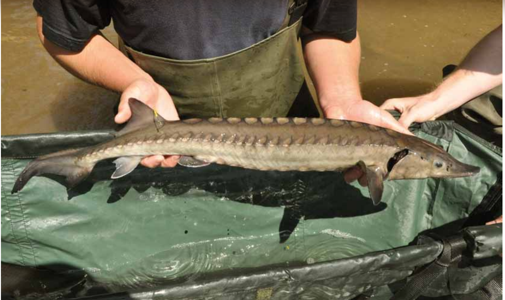
Een Atlantische steur voorzien van een merk en klaar om uitgezet te worden.