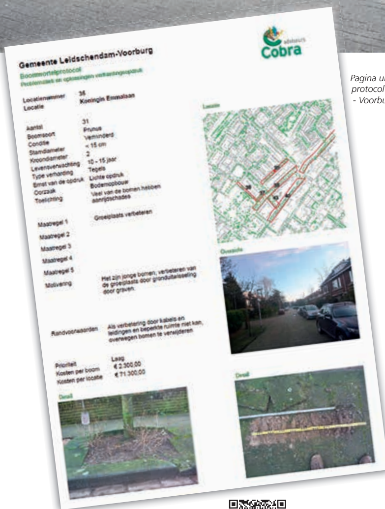
Pagina uit boomwortelprotocol Leidschendam - Voorburg