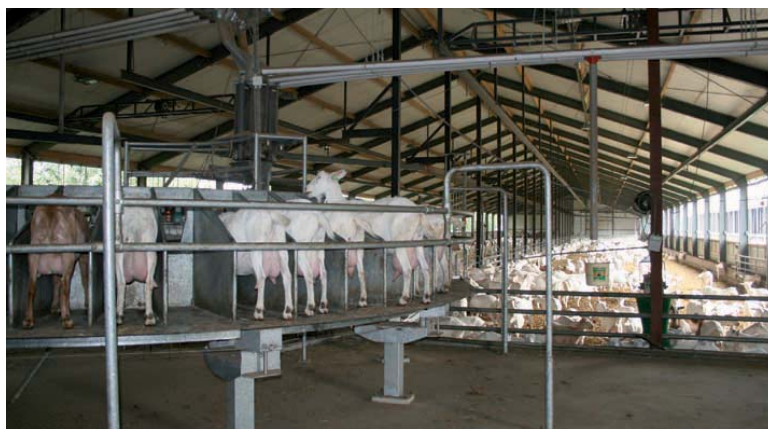
Beide potstallen zijn voorzien van een voercarrousel.

Franks bedrijf onderscheidt zich – naast de bovengemiddelde omvang – van de meeste andere bedrijven omdat er drie keer per jaar wordt gelammerd. "Op die manier smeer je de enorme arbeidspiek van het lammeren uit over drie momenten in het jaar. Daardoor kan ik ook deze arbeidsintensieve periodes met uitsluitend eigen medewerkers invullen en hoef ik geen tijdelijke arbeidskrachten te werven." Doel van deze werkwijze is een betere werksfeer met minder stressmomenten. Daarnaast komt het de