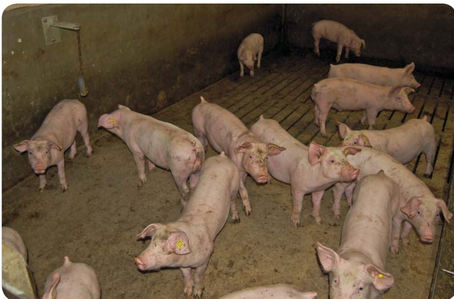
Om hokbevuiling te voorkomen, wordt het mestgedrag van de varkens zo gestuurd dat de dichte vloer het schoonst blijft.

Hoewel Arjan het bedrijf nu goed op orde heeft, blijft hij zoeken naar verbeterpunten. "Daarbij letten we er vooral op dat maatregelen praktisch en uitvoerbaar zijn. Zijn er bijvoorbeeld genoeg plaatsen om de hogedrukspuit aan de sluiten? Dat soort aandachtspunten. Er is altijd wel iets dat beter kan. Wij streven naar een uitvalspercentage van onder de 2% over een langjarig gemiddelde. Momenteel is dit 0,9%. Daarnaast willen wij een dierdagdosering die onder de 5 blijft (langjarig gemiddeld). Deze ligt momenteel net iets boven de 3. Voordat wij met een vaste vermeerderaar en een minder intensief hygiënebeleid werkten, lagen deze getallen vele malen hoger."