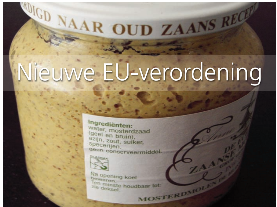
De ingrediëntendeclaratie van mosterd.