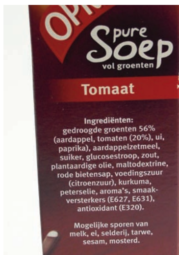
De allergenendeclaratie moet volgens de nieuwe verordening in een afwijkende typografie worden weergegeven.

De Commissie moet bovendien binnen drie jaar een voorstel doen om alcoholische dranken al dan niet onder de verordening te laten vallen, met name als het gaat om het vermelden van de hoeveelheid calorieën. Nu gelden de regels voor een ingrediënten- en een voedingswaardedeclaratie niet voor dranken met meer dan 1,2 procent alcohol. Bovendien moet de Commissie binnen drie jaar uitzoeken wat de gevolgen zijn van maatregelen over transvetzuren, zoals verplichte informatie aan de consument en beperking van het gebruik van transvet. De Europese Commissie wordt dus flink aan het werk gezet, waarbij hier direct aan kan worden toegevoegd dat de Commissie ruim de tijd krijgt om de voorstellen te formuleren. <<<