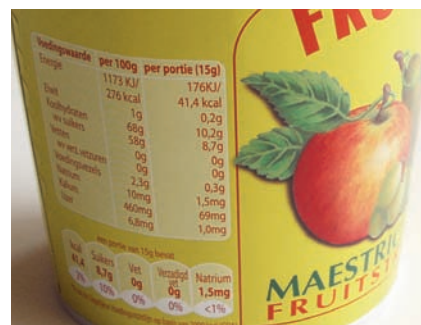
De voedingswaarde per 100 gram én per portie op Fruttesse fruitstroop.

De verordening heeft betrekking op levensmiddelen die zijn verpakt. Zoals vermeld moet echter bij niet-voorverpakte producten wel worden aangegeven of ze allergenen bevatten. Bovendien kunnen de EU-lidstaten ertoe overgaan alle of een deel van de nieuwe regels ook van toepassing te verklaren voor producten die niet voorverpakt zijn. Dat geeft wel aan dat ook met de nieuwe verordening de harmonisering niet volledig is.