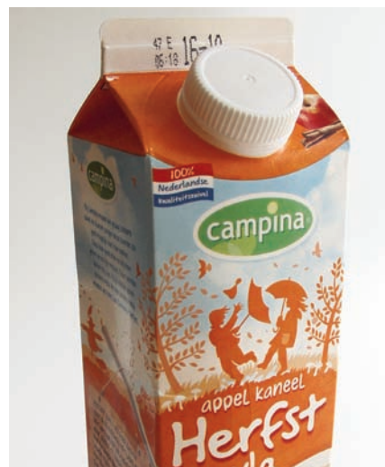
Op de herfstvla van Campina staat nu al duidelijk het land van herkomst van de melk aangegeven.