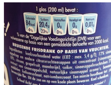
De icoontjes van de dagelijkse voedingsrichtlijn op Orangina, waaronder 'veradigd' vet.

vermelding van het land van herkomst van melk, melk als ingrediënt, niet bewerkte voedingsmiddelen, producten die maar uit één ingrediënt bestaan en ingrediënten die meer dan de helft van een product uitmaken.