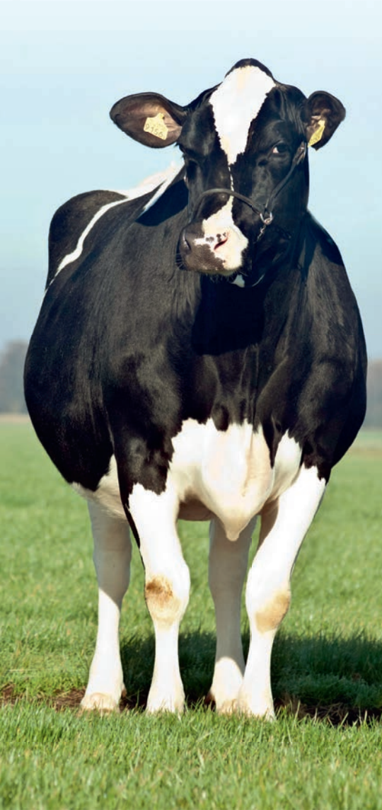
Etazon Renate, ook in de roodbonte en hoornloze fokkerij succesvol

Na zwartbont stromen genen van succesvolle familie door naar roodbont en hoornloos