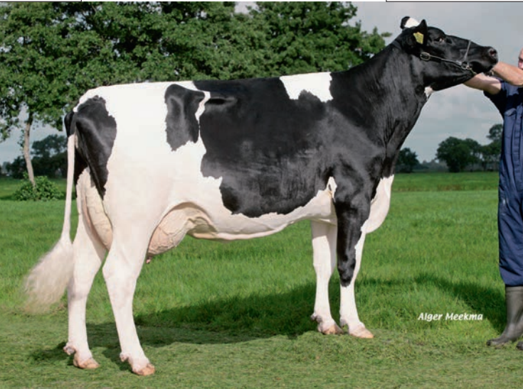
Etazon Renate fokt formaat en kracht