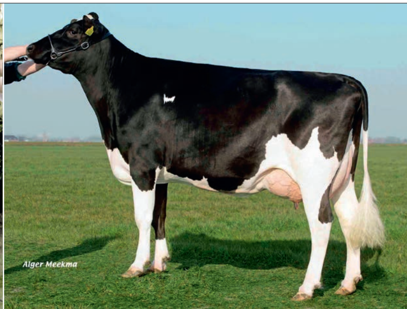
Midwolder Marjon, conditie én hoge productie