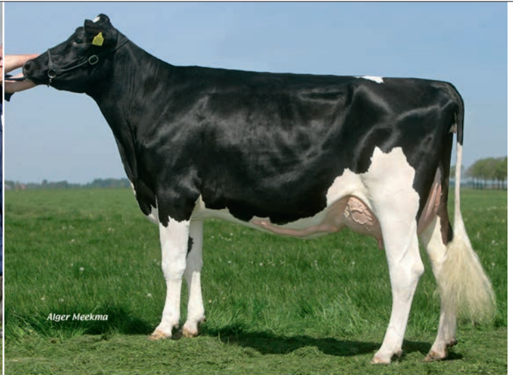
Marjon 15 combineert de power van Marjon met de fijnheid van Mascol

ben gecombineerd, haar nakomelingen hebben altijd mooie hellende kruizen.'