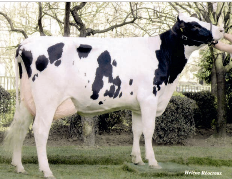
Remarlinda, excellente Jocko met vijf succesvolle O Mandochters