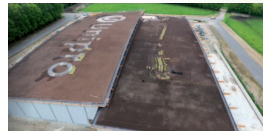
Farwick Groenspecialisten uit Enschede voorzag het dak van het bedrijfsgebouw van ruim 120.000 planten. Ook binnen in het gebouw bracht het groen aan, in de vorm van een duurzame moswand.

De geslaagde dag werd informeel afgesloten met een hapje en een drankje. ■