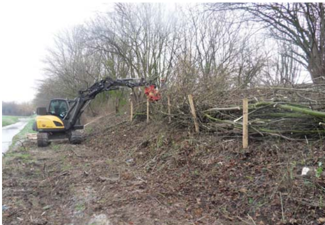
◀ Verhart groen is gespecialiseerd in onderhoud aan openbaar groen. In de winter heeft het bedrijf veel werk aan snoeiwerk. Daarvoor maakt het bedrijf ook veel machines zelf.