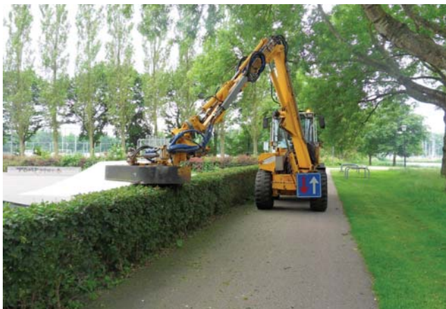
◀ Verhart is een van de specialisten in Nederland voor het machinaal knippen van hagen. Dit werk wordt gedaan voor provincies, rijkswaterstaat en gemeenten.