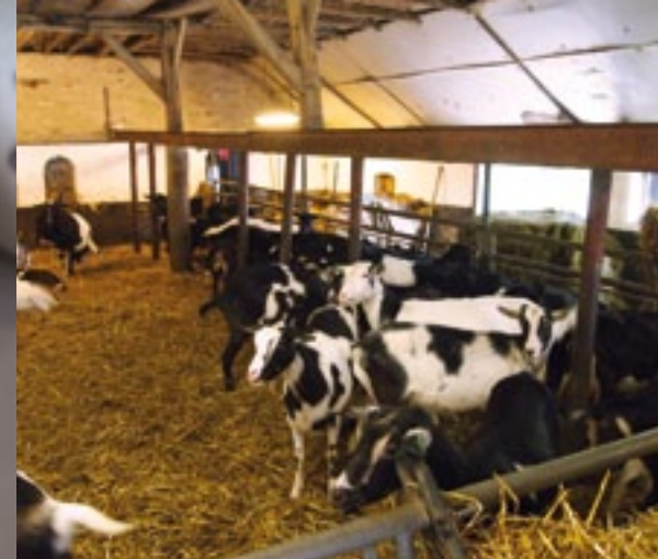
Hoewel er allerlei kruisingen lopen in de stal, houdt Kots het vooral bij Bonte geiten.