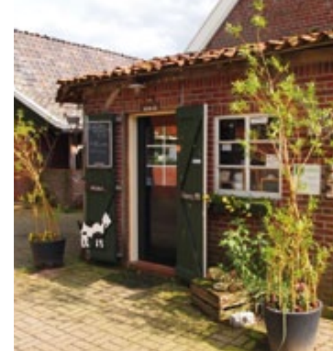
De winkel vormt zo'n beetje het middelpunt van het erf.