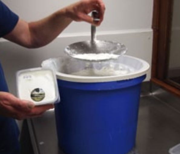
Met zijn geitenkwark won Kots de Cum Laude verkiezing 2014.