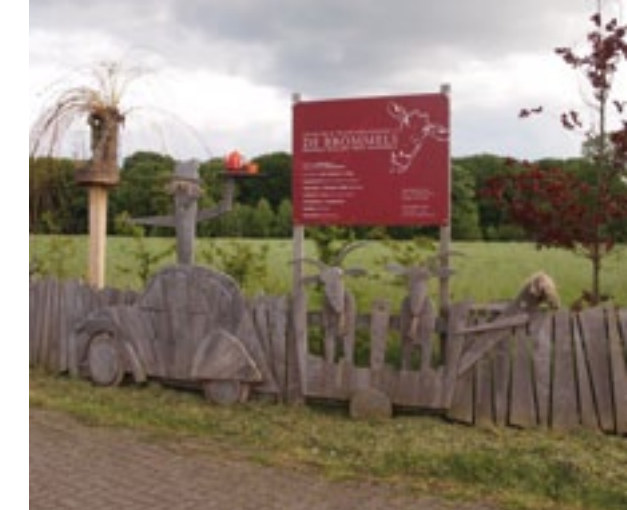
Het houtwerk op de toerit naar de boerderij geeft de passies van de bewoners weer.