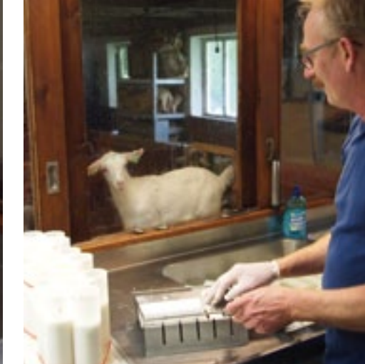
Tijdens het werk in de kaasmakerij heeft Kots zicht op de lammeren. En zij op hem.