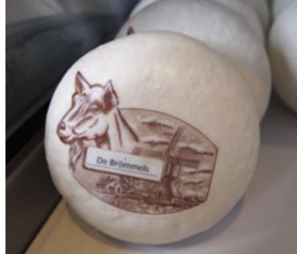
Pondskaasjes worden veel verkocht in de winkel op het erf van De Brömmels.