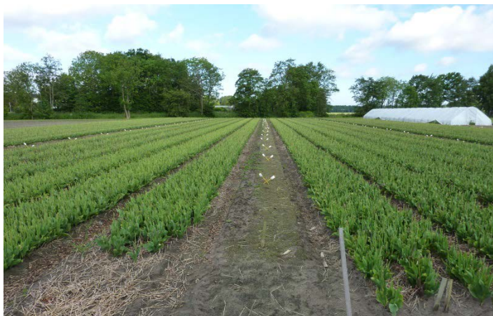
Foto 1. Overzicht proefveld 2013 beplant met tulp: 4 blokken van 6 bed breed en 80 m lang.

Tot en met 2011 is bladrammenas toegepast als groenbemester en vanaf 2013 is Japanse haver gezaaid. In 2013/2014 is het gehele perceel beteeld met tulp en in 2014/2015 zal dit narcis worden.