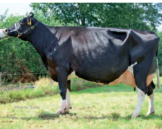
Andre 135 (v. Topaz), kampioene senioren zwartbont Levensproductie: 2335 65.235 4,46 3,65