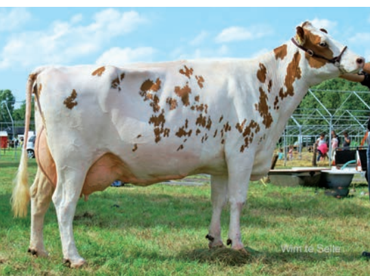
Truus 3860 (v. Classic), algemeen kampioene roodbont Prod.: 4.02 337 10.507 4,56 3,97 lw 116