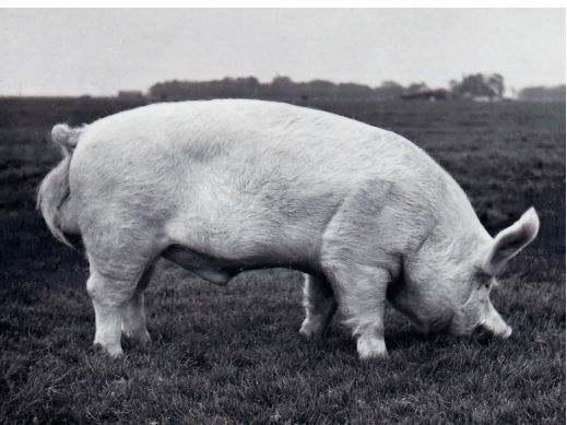
Groot Yorkshire, beer