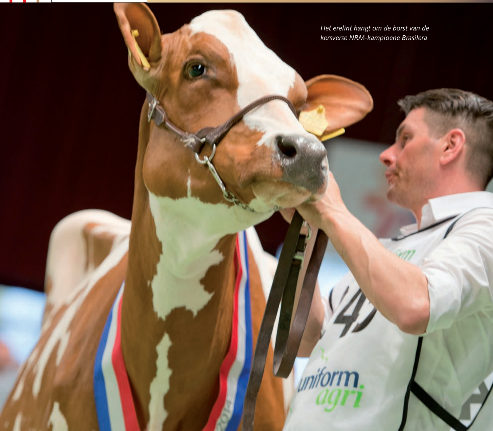
Het erelint hangt om de borst van de kersverse NRM-kampioene Brasilera